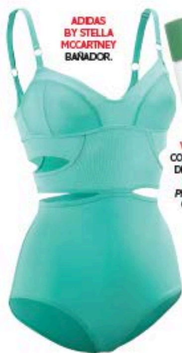
ADIDAS BY STELLA MCCARTNEY BAÑADOR.

Las terapias thalasso buscan la sanación a través de las bondades y tesoros del océano