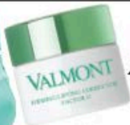
VALMONT CORRECTOR DE LINEAS, DAVINES PRIMER DE CABELLO.