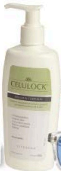
EFYDERMA PARA LA CELULITIS A BASE DE HERBAS; BLISS ANTIEDAD CON ALGAS MARINAS; OLIVER PEOPLES GAFAS DE SOL.