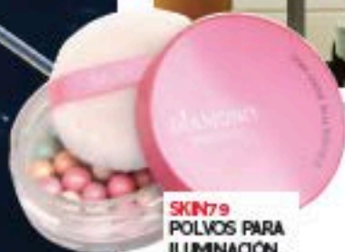
SKIN79 POLVOS PARA ILUMINACIÓN.

t ocar el océano con tus pies, sentir la brisa del mar y contemplar vistas de 360 grados desde la playa... ¡Es posible! El hotel Sofitel ofrece desde 1963 tratamientos de talasoterapia a la medida, para desintoxicar y revitalizar el organismo. Más información en softel.com .